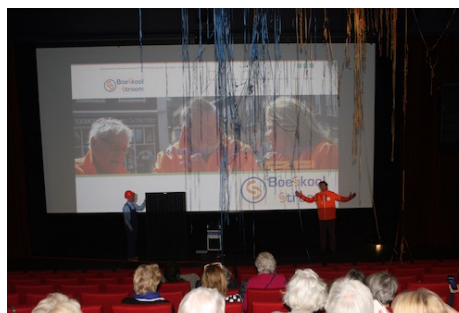
Resultaat van het slingerkanon