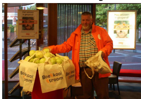
Een boeskool-tas voor iedereen